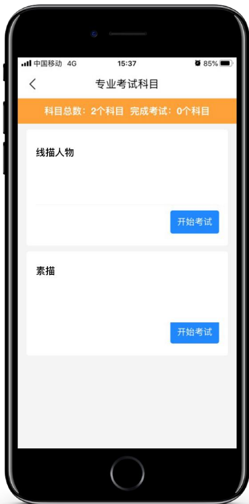
专业考试科目界面