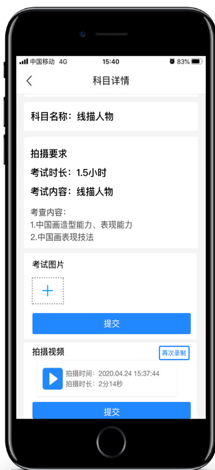
试卷照片及视频提交

录制视频结束后，考生须在考试规定的时间（“艺术升”APP平台录制的本专业科目一、科目二考试视频上传截止时间均为考试当天晚上 22:00。），点击并完成“正式考试”环节中手机 A 的“提交”操作，将手机 A 所录制的考试视频上传；